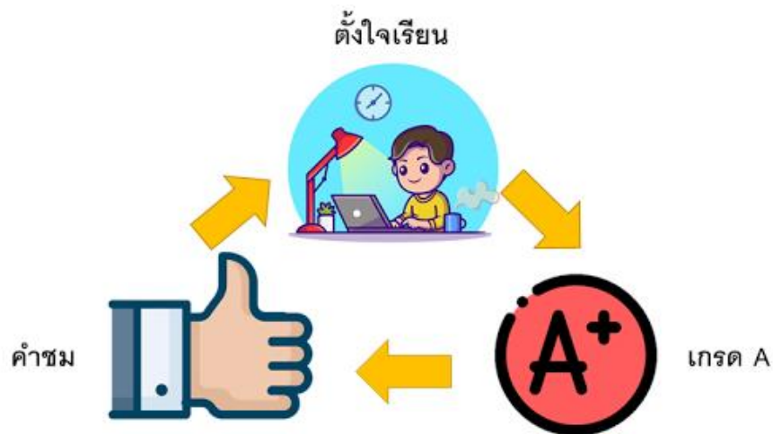
รูปที่ 2.2 แสดงการเสริมแรงพฤติกรรมและผลการเรียน

ทฤษฎีนี้มีประโยชน์ในการอธิบายพฤติกรรมของมนุษย์ และมีหลักการประยุกต์ใช้ที่มีประโยชน์หลายอย่าง ซึ่งหลักการของทฤษฎีนี้คือ พฤติกรรมของบุคคลเป็นผลพวงมาจากปฏิสัมพันธ์กับสิ่งแวดล้อม และพฤติกรรมสามารถเปลี่ยนแปลงได้เนื่องจากผลกระทบที่เกิดขึ้นในสภาพแวดล้อมนั้น อธิบายให้เข้าใจง่าย ๆ คือ มนุษย์เรามีวงจรนิสัยอยู่ โดยจะยกตัวอย่างกรณีอาจารย์และนักศึกษา