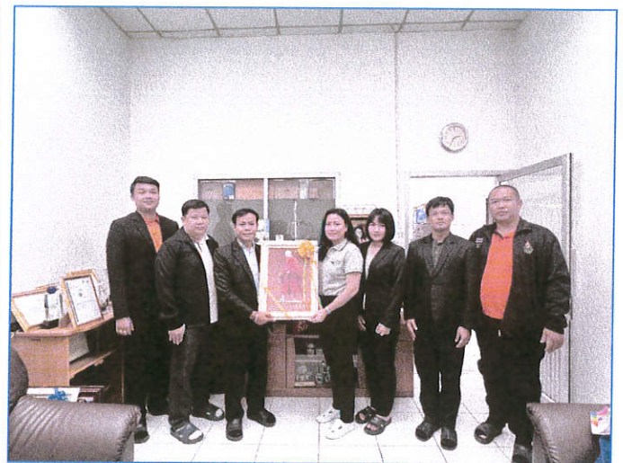
บริษัท ทีเคซี โพรเกรส จำกัด