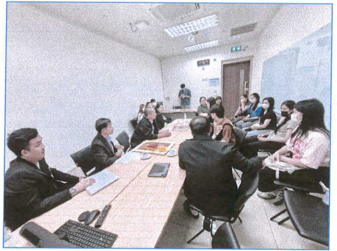
บริษัท ซีพีแรม ลาดกระบัง (เบเกอรี่ตราเลขแปด)