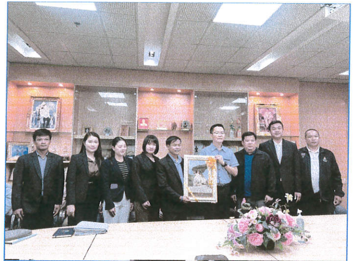
บริษัท ซีฟิวอลล์ จำกัด มหาชน