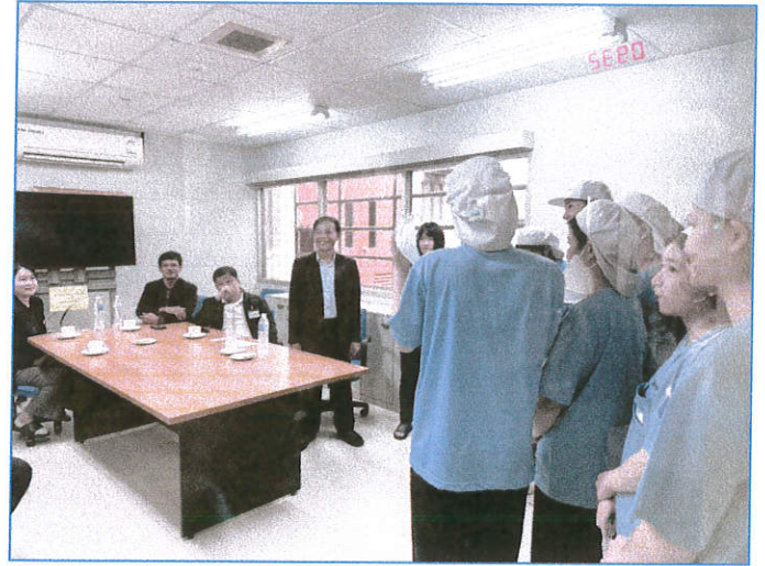
บริษัท พุจิคุระ อิเล็กทรอนิกส์ คอมโพเน้นส์ (ประเทศไทย) จำกัด